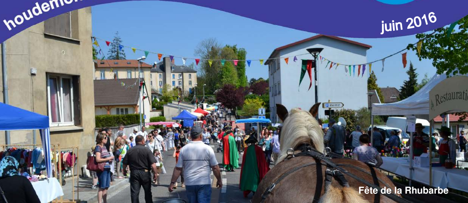
Fête de la Rhubarbe