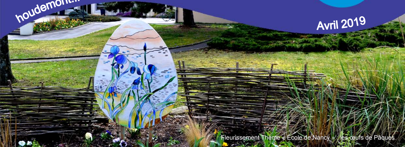
Fleurissement Thème « Ecole de Nancy » : les œufs de Pâques