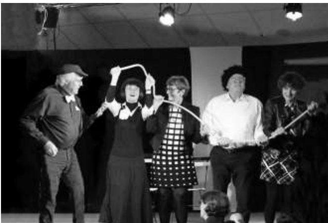
2018 - "On ne va pas y passer la nuit"

Une troupe de comédiens amateurs s'est constituée à HOUEMONT en 1987, intitulée "Théâtre des Sources". Forte de ses 34 ans d'existence, elle est une des associations les plus anciennes de la commune. Le groupe a connu des hauts et des bas, selon l'implication des acteurs et la disponibilité de divers "coachs".