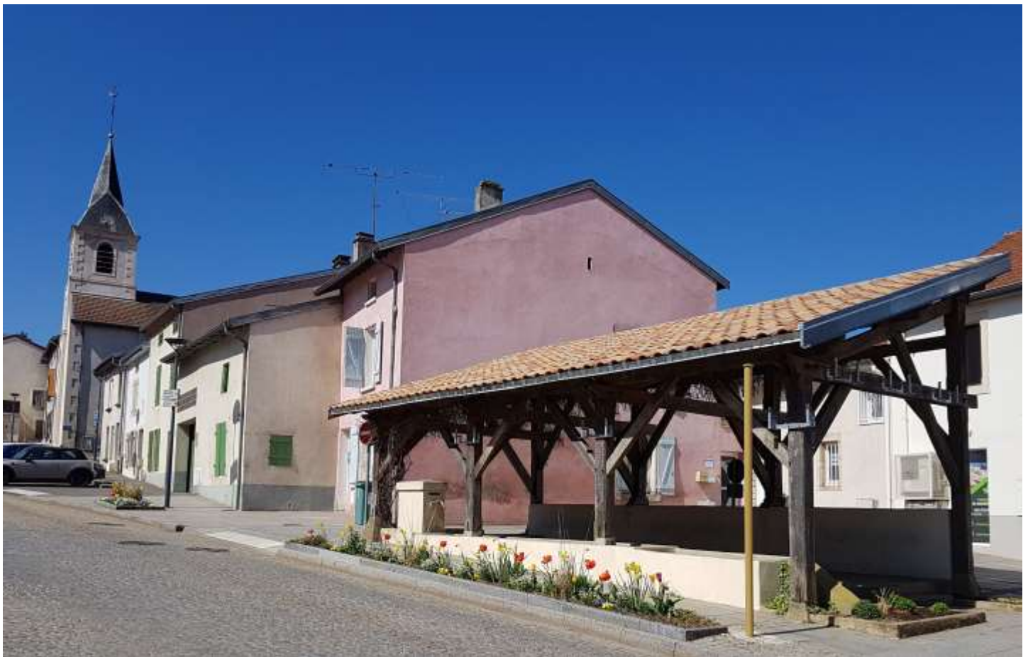
Réfection de la toiture du lavoir