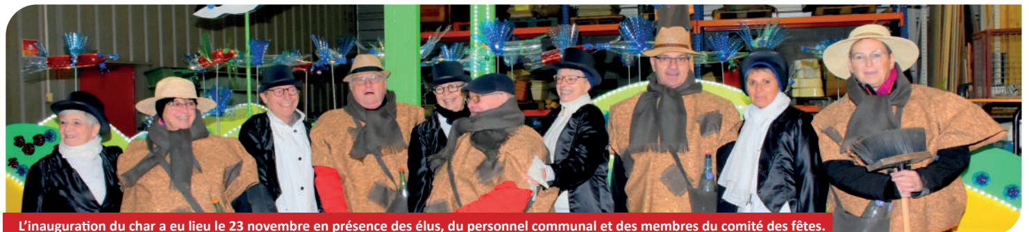
L'inauguration du char a eu lieu le 23 novembre en présence des élus, du personnel communal et des membres du comité des fêtes.

Le char de la ville de Houdemont était présent sur les défilés de Villers-lès-Nancy, Nancy, Houdemont, Vandoeuvre-lès-Nancy, Jarville-la-Malgrange, Laneuveville-devant Nancy, Heillecourt, Ludres, Fléville.