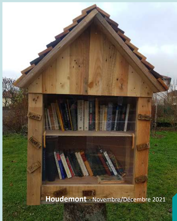
Houdemont - Novembre/Décembre 2021

Elles ont été installées place du Château, rue du Poncel et près de l'abri de bus au croisement entre la rue de la Gare et la rue du Poncel.