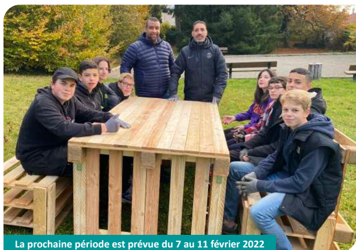
La prochaine période est prévue du 7 au 11 février 2022

Huit jeunes ont participé à cette 3 e période. Ils ont fabriqué un deuxième arbre à livres et ont effectué des travaux de nettoyage du cimetière.