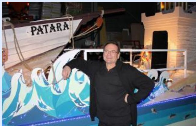
Le « PATARA », ainsi baptisé pour évoquer la ville de naissance de Saint Nicolas