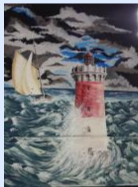
L'arrière du char peint par Christian Broust

Dès le 5 décembre, les bénévoles du Comité des fêtes de Houdemont, ont accompagné leur char au sein du cortège joyeux et coloré. Ils ont parcouru les artères de quelques villes de la Communauté Urbaine : Nancy, Jarville, Heillecourt, Fléville, Ludres, avant de terminer en apothéose le dimanche 12 décembre dans les rues de notre commune.