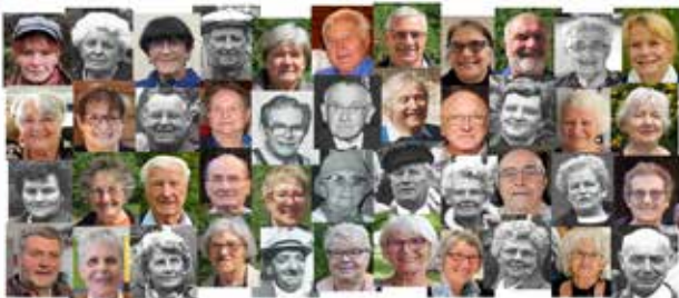
Toujours le même but depuis 1966 : "Renforcer l'amitié solidaire"

La célébration officielle et festive de cet anniversaire aura lieu le samedi 30 mai 2026 à 14h00 à la salle polyvalente. Tous les habitants de la ville y sont conviés, sur inscription. Les détails de cet événement sont disponibles sur : https://houdseniors.blogspot.com .